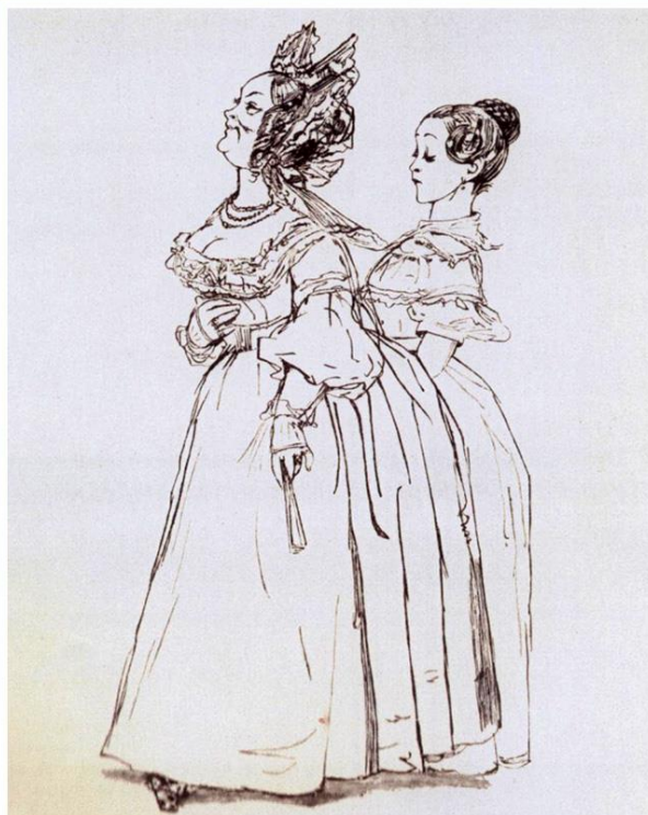
Семейство Городничего представляется Хлестакову