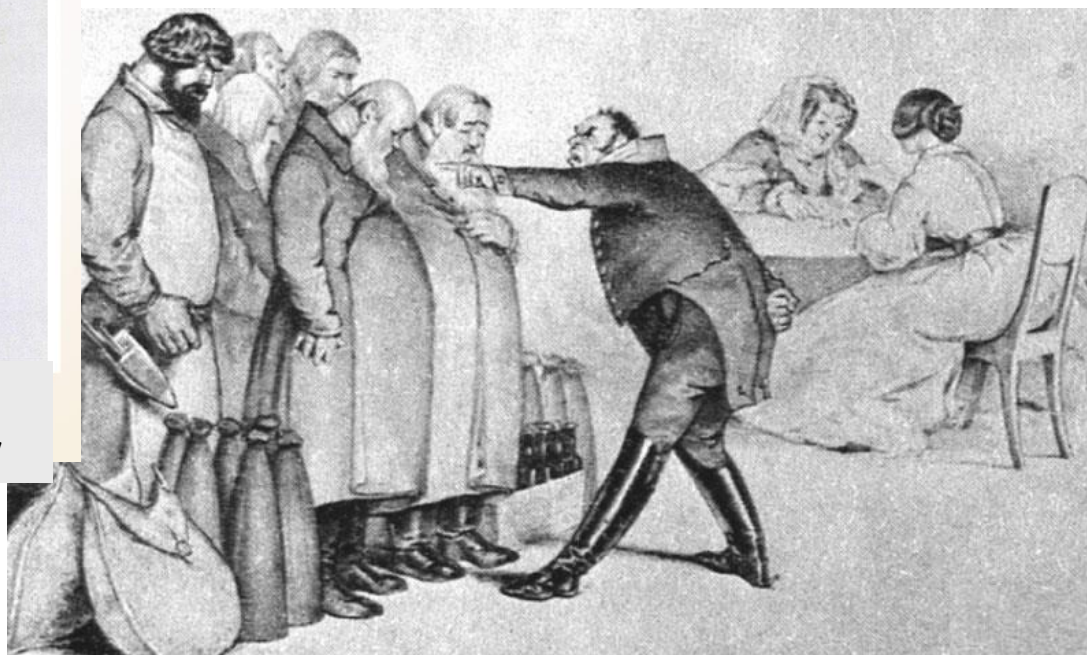
Городничий и купцы