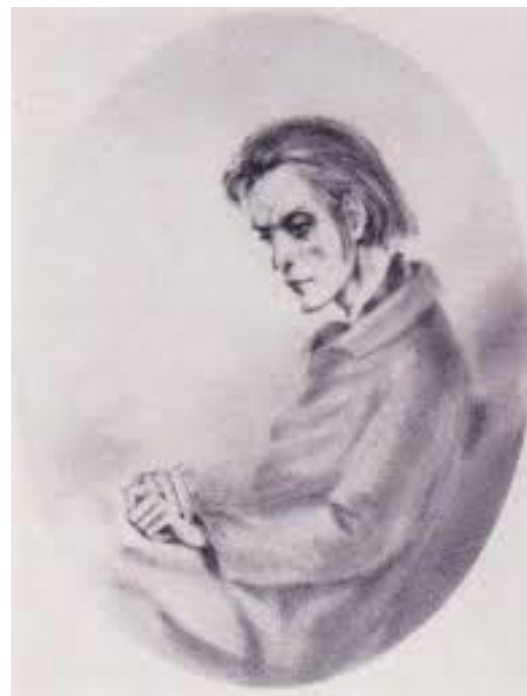
Иллюстрация к роману

«Преступление и наказание» Ф.М. Достоевского