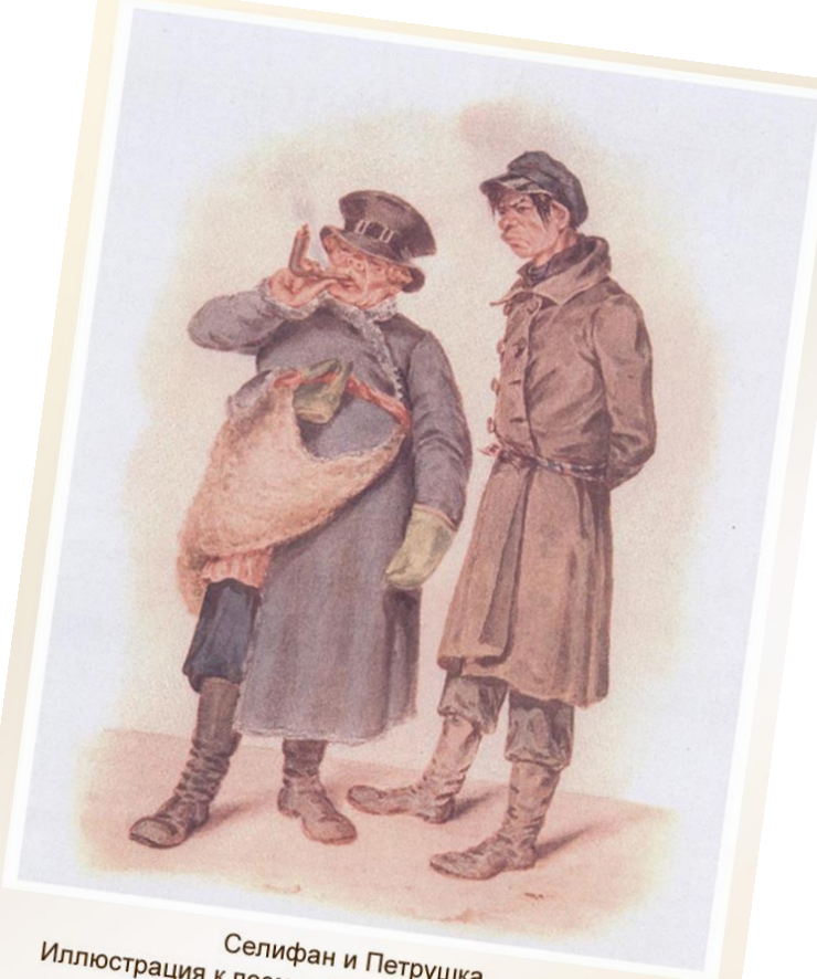
Селифан и Петрушка. Иллюстрация к поэме Н.В. Гоголя «Мертвые души» Акварель П. Боклевского