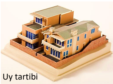
Uy tartibi Макет дома

Модель — это упрощенное подобие реального объекта.