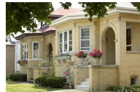
Uy fotosurati Фотография дома